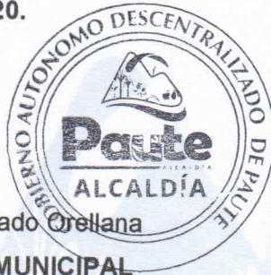
Ing. Raúl Remigio Delgado Orellana ALCALDE DEL GAD MUNICIPAL DEL CANTÓN PAUTE

Dado y firmado, en la Sala de Sesiones del Concejo Cantonal del Gobierno Autónomo Descentralizado Municipal de Paute, a los dieciseis días del mes abril del año de 2020. Paute, 16 de abril de 2020.